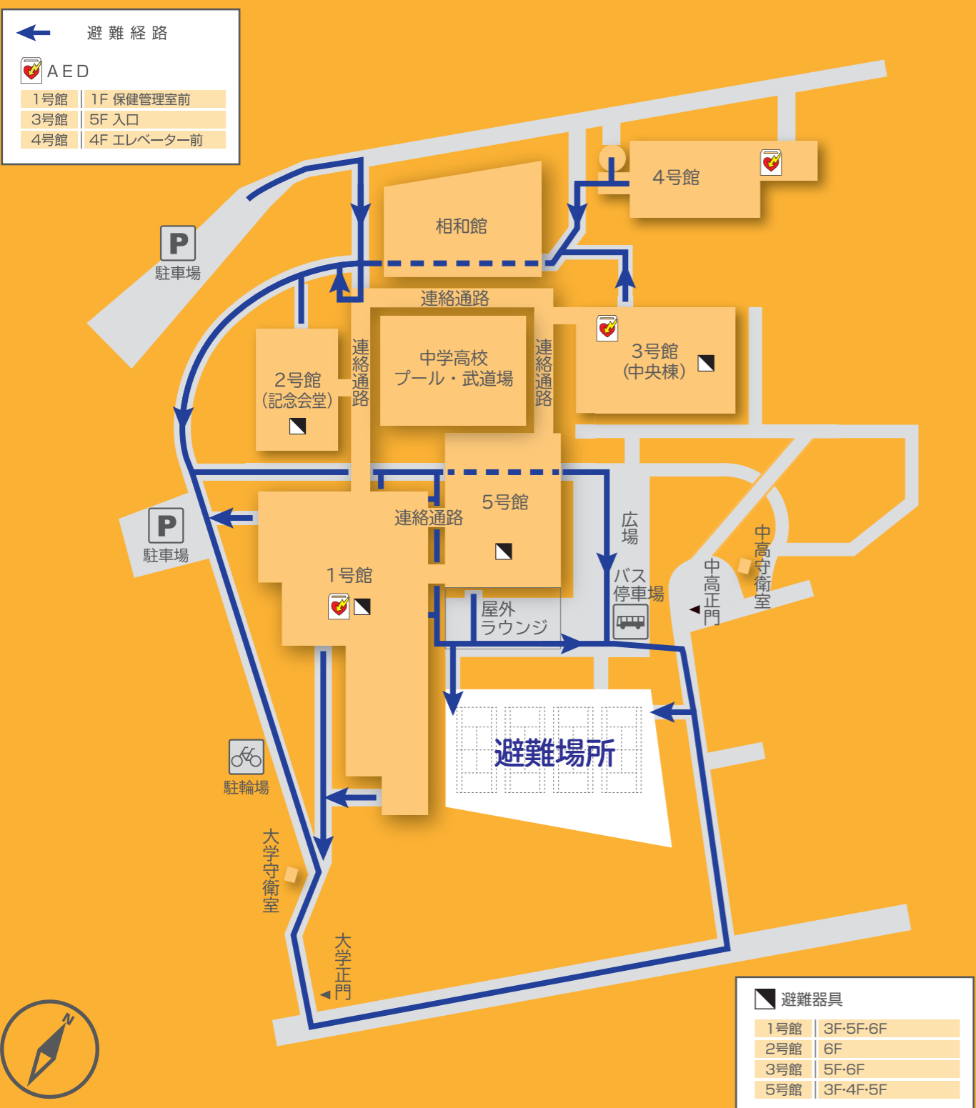
Hoshigaoka Campus Map 星が丘キャンパス避難経路図