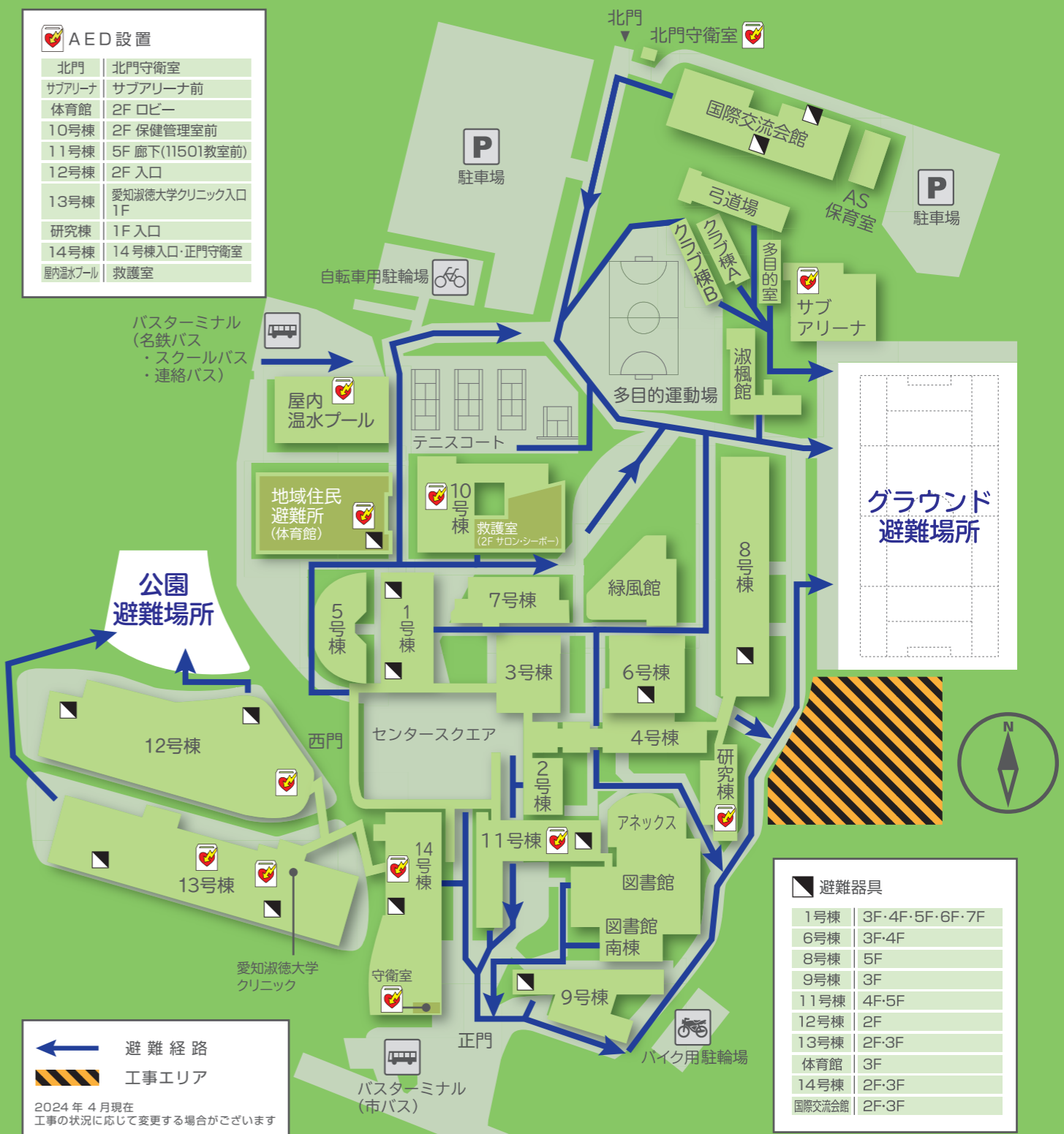
Nagakute Campus Map 長久手キャンパス避難経路図