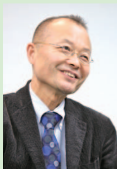
教職・司書・学芸員教育センター長 愛知淑徳大学 文学部 教授