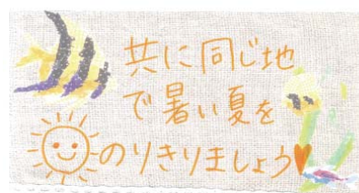
扇風機に寄せられた学生からのメッセージ