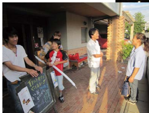
地域の方も気軽に参加☆