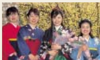
昨年の大学卒業式