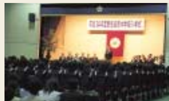
昨年の中学校入学式

本学としては初めて、大学基準協会に相互評価(第三者評価)を申請し、審査を受けました。その審査の一連として、昨年11月19・20日の2日間にわたって、長久手・星が丘両キャンパスの視察が行われました。 なお、先に提出した報告書及び実施視察の結果をふまえ、本年度末に書面での評価が届く予定です。