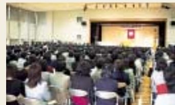
昨年の高等学校入学式