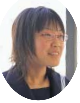
命勉強して、得意と言えるようになりたいです。友だちをた

淑徳高校から愛知淑徳大学に進んだ姉がいます。姉から淑徳高校は女子校だから、自然体で過ごせると聞いたのでいいなと思って推薦入試で入学しました。中学では英語が好きでしたが得意ではなかったため、高校で一生懸命勉強して、得意と言えるようになりたいです。友だちをた