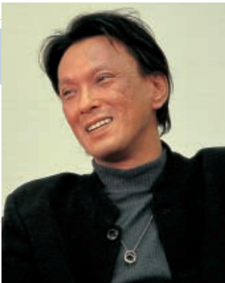
医療福祉学部 医療貢献学科主任