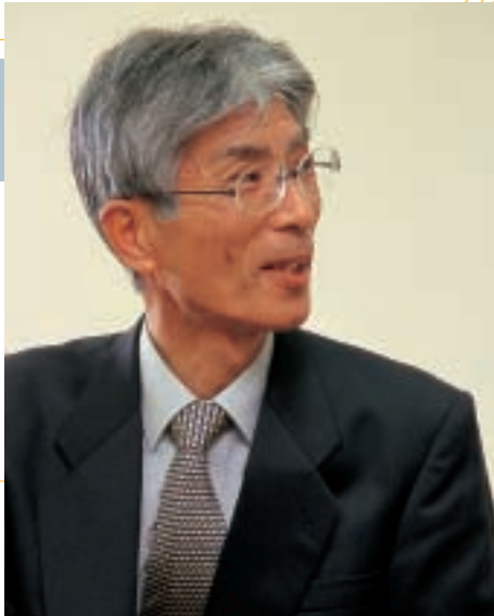
医療福祉学部 福祉貢献学科主任