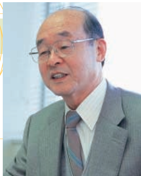
ビジネス学部学部長