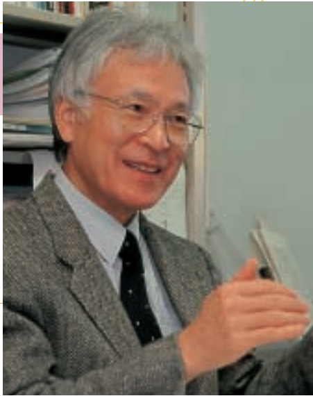
文化創造研究科研究科長