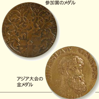
メルボルン・オリンピックの参加賞のメダル