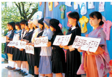
歴代制服ファッションショー