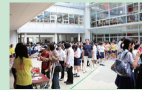
模擬店には行列が