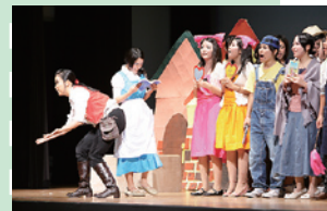
大アリーナ部門 ミュージカル