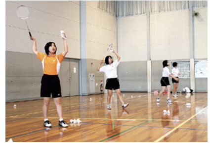
バドミントン部練習風景