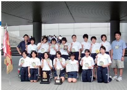
第65回愛知県中学校総合体育大会水泳競技大会 女子の部 総合優勝