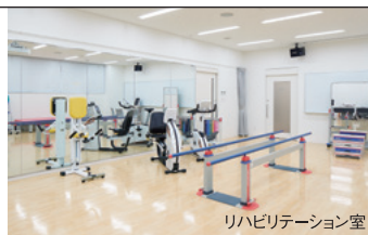
リハビリテーション室

「リハビリテーション科」では、疾患や外傷で起こる障がいを診療し、個々の能力やゴールに応じた訓練を行うことで最良の機能回復や社会復帰・家庭復帰を支えます。リハビリテーション専門医と療法士などを中心とした医療チームが患者さま一人ひとりと向き合い、生活の質の改善・向上に導きます。