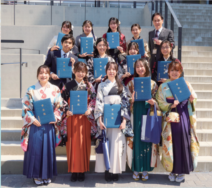
■ 愛知淑徳大学 令和7年度卒業式／愛知淑徳大学 令和8年度入学式