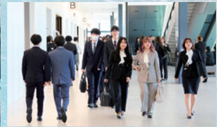
■ 愛知淑徳高等学校 第78回(令和7年度)卒業証書授与式／愛知淑徳中学校 第80回(令和8年度)入学式