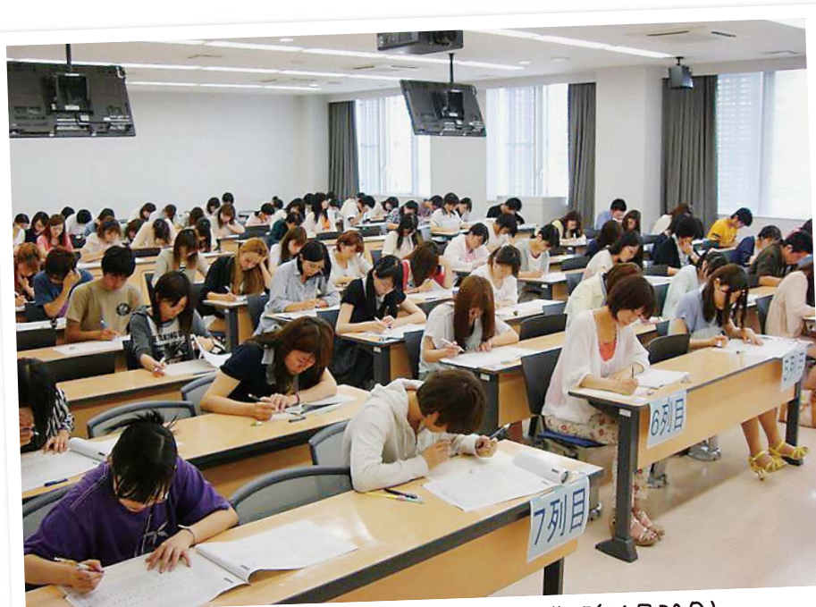
日本漢字能力検定学内団体受検の様子（平成25年6月30日）

全学日本語教育部門は、学生の日本語運用力（Japanese Literacy）向上をサポートする組織です。ここから、学内における日本語運用力向上に向けたさまざまな取り組みを広く発信したいという気持ちを、“@”に込めました。